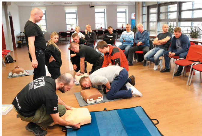
Szkolenia z udzielania pierwszej pomocy i używania defibrylatorów poprowadzili specjaliści