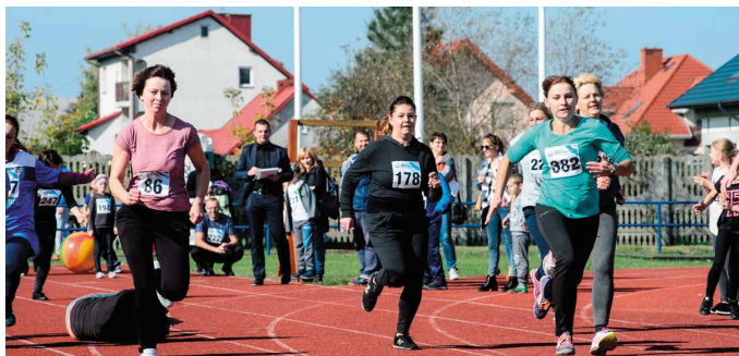
Wraz z dziećmi do rywalizacji sportowej stanęli również rodzice, którzy wykazali się dobrą kondycją