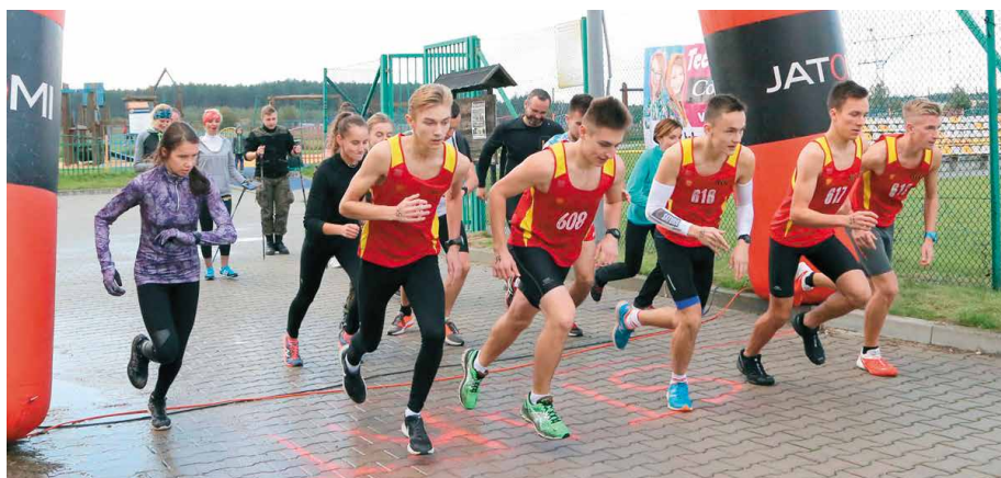
Zawodnicy dali z siebie wszystko podczas sportowej soboty w Bilczy