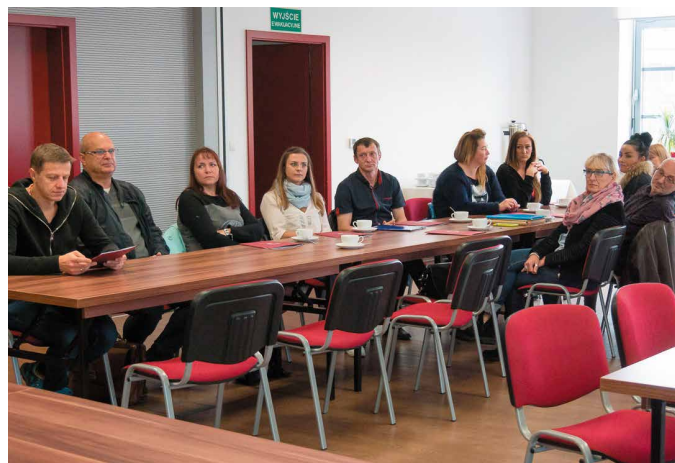
Każda z dziesięciu nowych firm otrzyma dofinansowanie w kwocie 21 tysięcy złotych