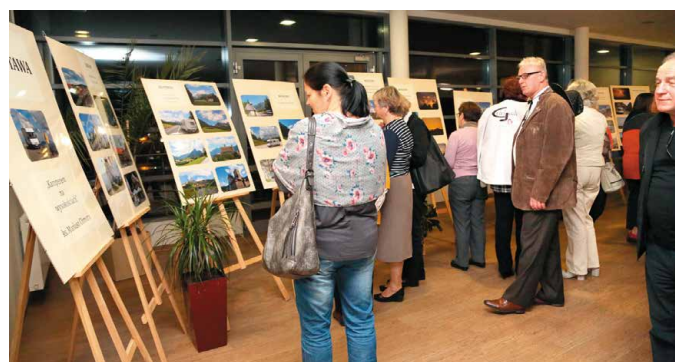
Wystawa zdjęć z podróży zachwycała przybyłych na wernisaż gości

turystów. - Byłby to drugi etap rozbudowy naszego terenu rekreacyjnego, na którym już w tej chwili znajduje się zbiornik wodny i park linowy. Powstaną tu także ścieżki rowerowe oraz skatepark i oczywiście pole dla karawaniingu. Zanim jednak zaczniemy budowę musimy zmienić w tym miejscu plan zagospodarowania przestrzennego, a to dlatego, że niektórych inwestycji nie można realizować na terenie leśnym. Aby od strony formalnej było wszystko tak jak trzeba, musimy przekształcić las w park – wyjaśnia Burmistrz Miasta i Gminy Morawica, Marian Buras i dodaje, że zmiana planu zagospodarowania przestrzennego to dosyć długotrwały proces. - Gdyby wszystko poszło optymistycznie, to pod koniec 2018 roku plan zostanie zmieniony, a budowa pola karawaniowego wraz z koniecznym budynkiem, w którym mieściłoby się pełne zaplecze ruszyłaby w 2019 roku – zapowiada burmistrz. - Wtedy to powstałby tam ośrodek rekreacyjny z prawdziwego zdarzenia. Zależy nam na tym, aby turyści zatrzymywali się w Morawicy na dłużej. Takie miejsce dla karawaniingu mogłoby być doskonałym miejscem wypadowym na całe województwo świętokrzyskie z bazą noclegową właśnie u nas – dodaje burmistrz, Marian Buras.