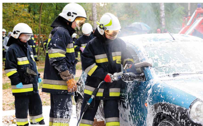
Druhowie wykazali się gotowością bojową na najwyższym poziomie