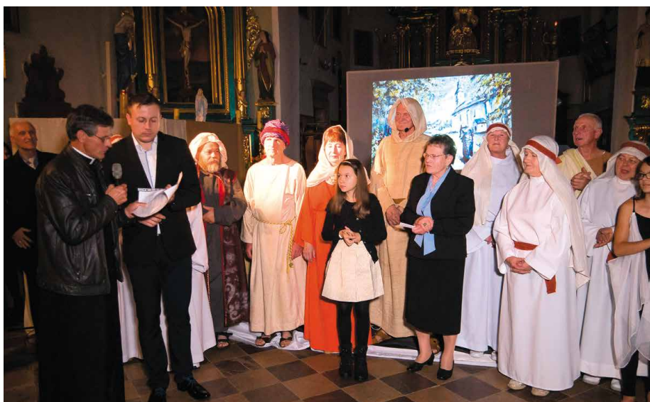
Aktorzy i reżyserzy wieczornicy zostali nagrodzeni gromkimi brawami