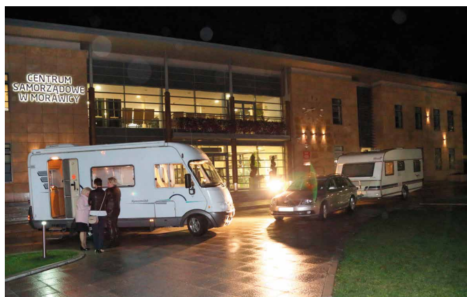
Pole dla takich właśnie kamperów ma powstać w Morawicy nieopodal zalewu

Na zakończenie spotkania podziękowano jego bohaterowi i zaproszono gości na zwiedzanie niezwykłej wystawy fotografii z wyprawy kamperem po francuskich i włoskich Alpach. Można także było obejrzeć kampera zaparkowanego tuż przed budynkiem Centrum Samorządowego w Morawicy.