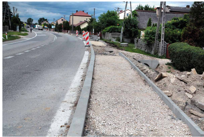
fol. A. Radomski