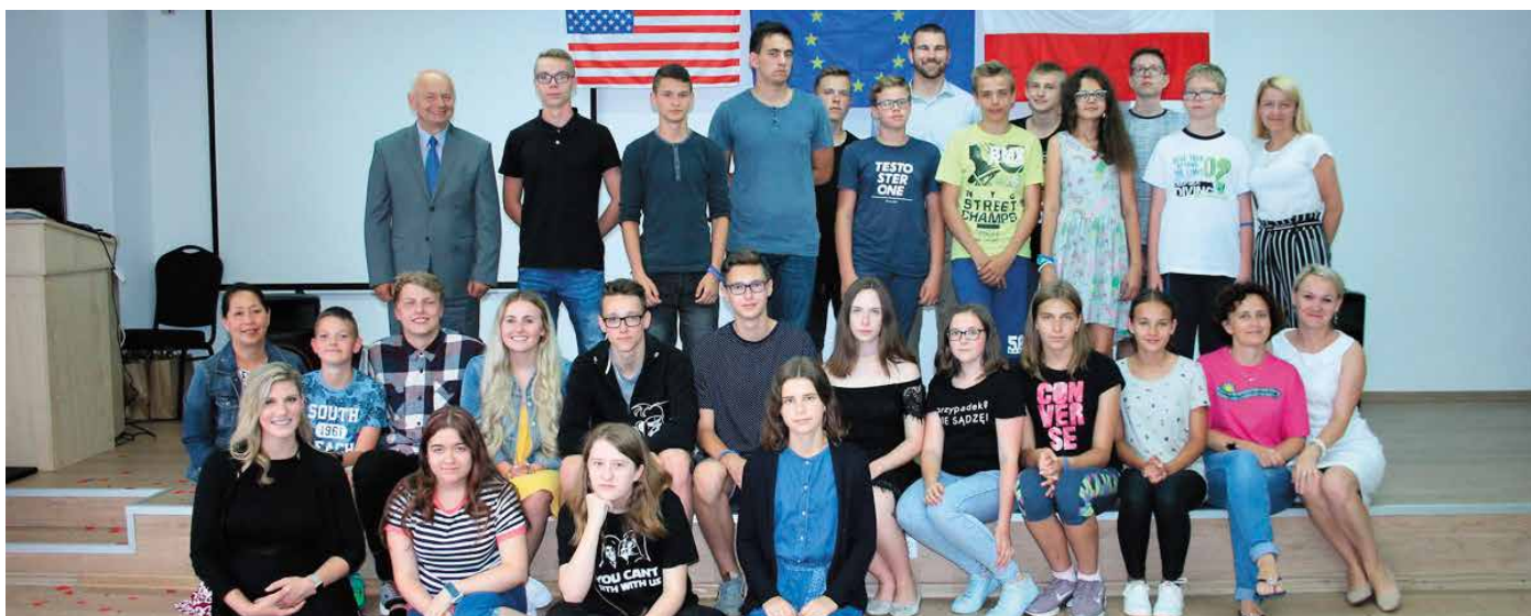
Dwudziestu uczniów z terenu Miasta i Gminy Morawica uczestniczyło w warsztatach prowadzonych przez wolontariuszy – nauczycieli z Miasta Camas w USA.