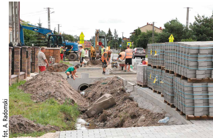
fol. A. Radomski