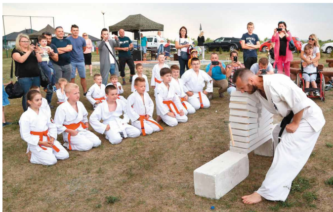
fol. A. Radomski