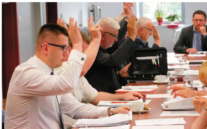
Radni Rady Miejskiej w Morawicy byli zgodni co do udzielenia jednogłośnie absolutorium za 2016 rok Burmistrzowi Miasta i Gminy Morawica