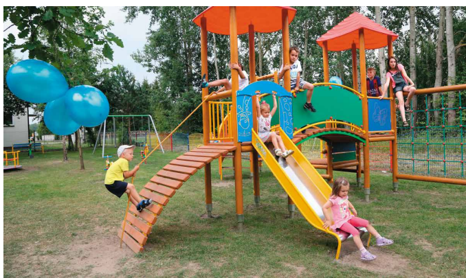
fol. A. Radomski