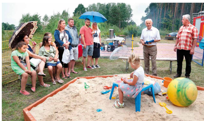
fol. A. Radomski