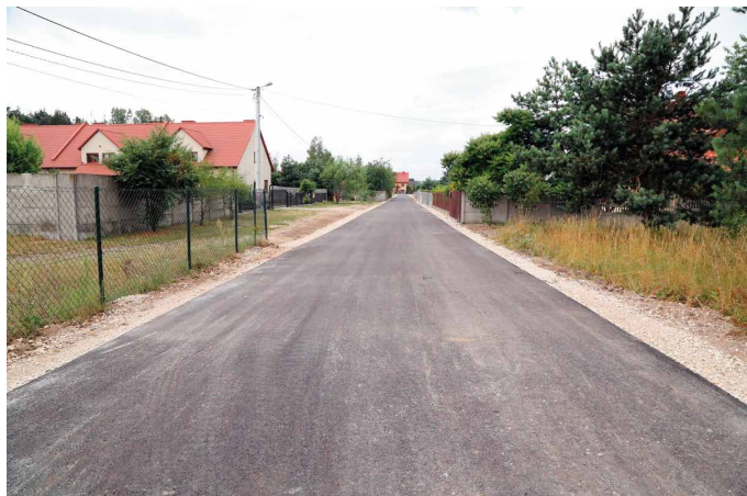
fol. A. Radomski