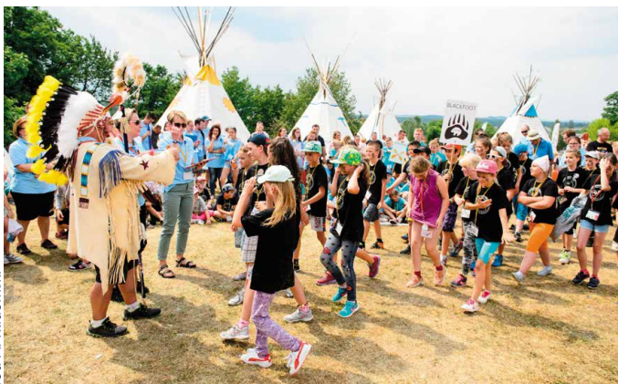
Tegoroczna edycja „Wioski Indiańskiej” była rekordowa pod każdym względem