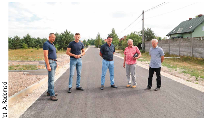
fol. A. Radomski