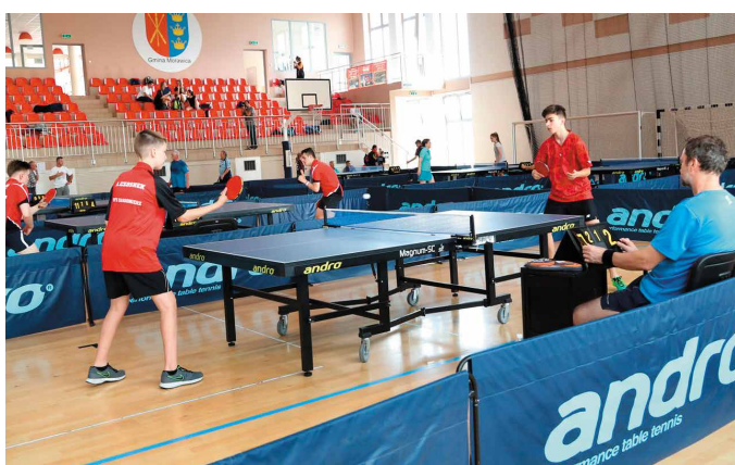
Do hali sportowej w Bilczy zjechali najlepsi zawodnicy

Po blisko całonocnych rozgrywkach w końcu wyłoniono mistrzów w poszczególnych kategoriach. Dla najlepszych zawodników wręczono puchary, dyplomy i upominki. Warto dodać, że celem wydarzenia była masowa popularyzacja tenisa stołowego oraz krzewienie idei sportu.