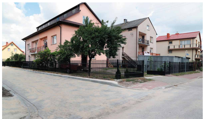
fol. A. Radomski