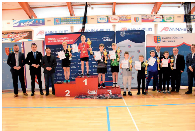
Najlepsi w GP Polski w kat. Żaków.

Ponad 200 zawodniczek i zawodników uczestniczyło od 11 do 13 marca w Grand Prix Polski. Zawody zakończyły się triumfami zawodników rozstawionych z „trójką”. W gronie żaczek,