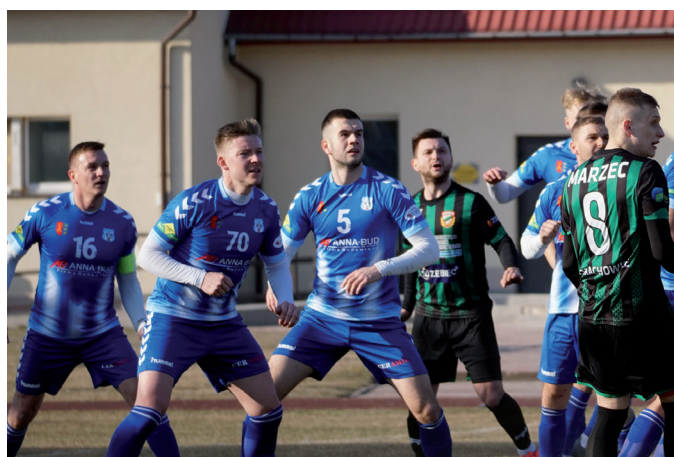
Mecz Moravia Anna-Bud vs Star.

Pomimo zdecydowanie lepszej grze niż w rundzie jesiennej, na początek rundy wiosennej Moravia Anna-Bud dzieli się punktami z rywalami. Ale są to bardzo cenne punkty ponieważ gra-