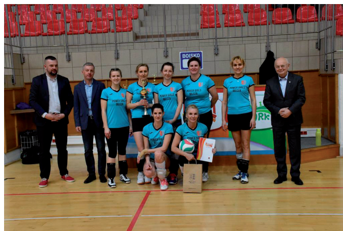
Power Girls Bilcza.