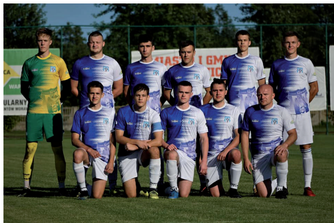
Moravia Anna-Bud II.

W okresie przygotowawczym do rundy wiosennej oba nasze zespoły seniorskie zagrały wiele spotkań z różnym skutkiem, ale najważniejsze jest zgranie zespołu przed drugą częścią