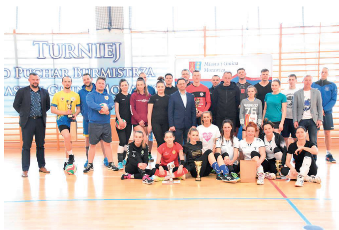
Finaliści charytatywnego Turnieju.

Dużym sukcesem sportowym i organizacyjnym zakończył się Charytatywny Turniej w Piłce Siatkowej Mikstów, który zo-