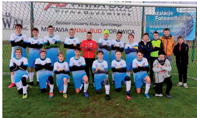
Moravia Anna-Bud Morawica

mecze o godz. 11:00 z Korona SA Kielce (23 kwietnia) i Orle-tami Kielce (30 kwietnia). Juniorzy starsi trenowani przez Da-miana Detkę zagrają 23 kwietnia z Partyzantem Wodzisław. Plan meczy seniorów na własnych obiektach przedstawia się