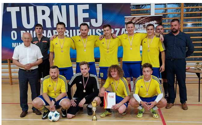
CK Team – mistrz WLPP '2022.

Po dwuletniej przerwie spowodowanej obostrzeniami z powodu panującego wirusa odbyła się VII edycja Wakacyjnej Ligi Piątek Piłkarskich o Puchar Burmistrza Miasta i Gminy Morawica. Uczestnicy rozgrywek, których organizatorem był Koral Sport i Rekreacja rozegrali 40 meczy, podczas których padło 120 bramek. Tegoroczna edycja odbywała się na boiskach wielofunkcyjnych w miejscowościach Lisów, Ni-