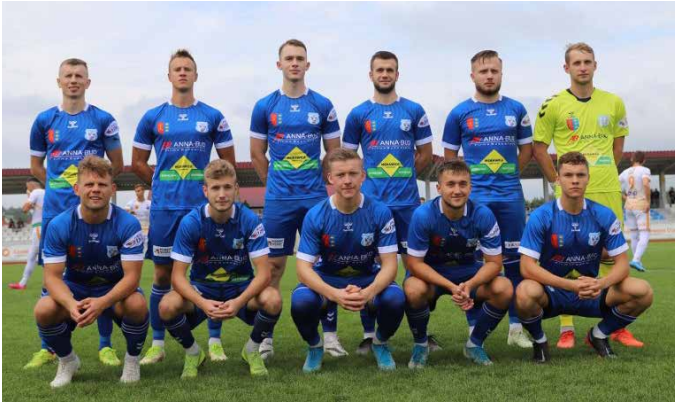
Moravia Anna-Bud Morawica – przed meczem z Alitem.