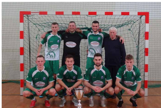
Tompawex Obice.

Po kilku próbach i dwóch przegranych finałach wojewódzkich, futsalowa ekipa Tompawex Obice zdobyła Puchar Polski na szczeblu województwa Świętokrzyskiego. W rozgrywkach w Jędrzejowie finałach wygrywali kolejno z Auto Komis Daniel Zych 10:3, Simset.Net Jędrzejów 3:1, FC Pińczów 5:1 (ćwierćfinał), UKS Futsal Pińczów 1:0 (półfinał), Simset.Net Jędrzejów 7:2 (finał). Dzięki zdobyciu PP reprezentowali Miasto i Gminę Morawica w Pucharze Polski na szczeblu ogólnopolskim, w rozegranym w Święto Trzech Króli meczu II rundy