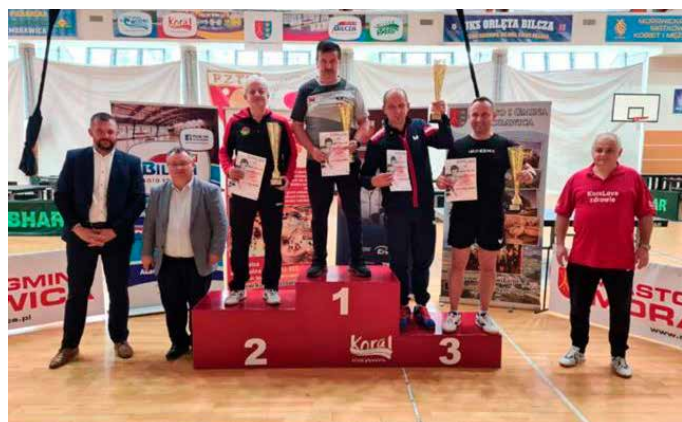
Laureaci GP Weteranów 2021.

w sparingach pokazuje że zespół ma bardzo duży potencjał. W rozegranych do tej pory 6 meczach kontrolnych padły następujące wyniki: z ŁKS Łągów (zaw. testowani) 2:0,