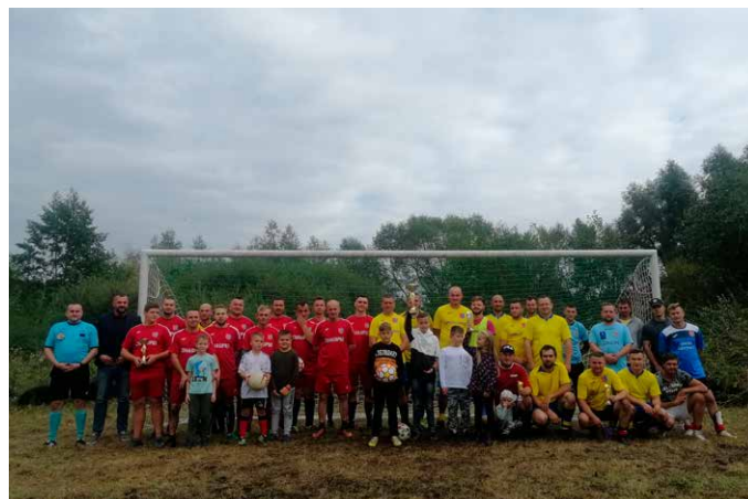
Wspólne zdjęcie XXVI edycji.