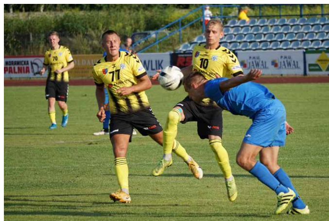
Mecz Moravia-GKS Rudki.

Dwie mistrzowskie imprezy w tenisie stołowym będą gościć w Hali Sportowej Bilcza. Najpierw w dniach 11-13 marca 2022r. rozegrane zostanie Grand Prix Polski Żaków, a miesiąc