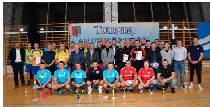
Zdjęcie z zakończenia turnieju OSP.

Pięcioletnia dominacja strażaków z Obic w turnieju piłkarskim o Puchar Burmistrza Miasta i Gminy Morawica została przerwana. OSP Morawica przerwała hegemonię braci Zawadzkich i wygrała najliczniej obsadzoną edycję. Oprócz finalistów zagrały także zespoły OSP z Chałupek (III m.), Brzezin (IV m.), Brudzowa (V m.), Bilczy (VI m.), Woli Morawickiej