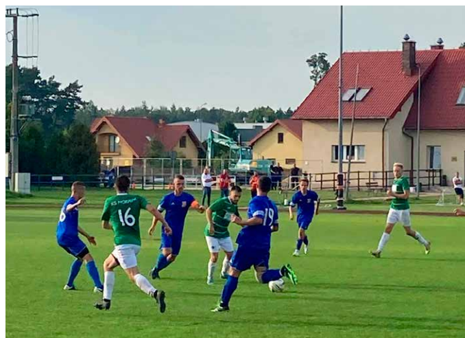
Mecz Moravia II -Naprzód.