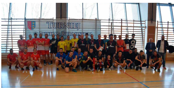
Uczestnicy VII edycji MLS Mężczyzn.

Zespół MT2 wygrał VII edycję Morawickiej Ligi Siatkówki Mężczyzn, po niezwykle emocjonującym spotkaniu finałowym pokonał w finale Kanapowców (przegrywali już 1:2), trzecie miejsce przypadło dla zespołu Albatrosów, którzy także w tie-breku pokonali Golden Team Bilcza. Piąte miejsce dla zespołu Tłoczyska po wygraniu tie-breku z WAS