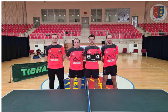
UKS Orłęta Bilcza (II liga).

Zespoły UKS Orłęta Bilcza uczestniczące w rozgrywkach ligowych tenisa stołowego rozpoczęły rundę rewanżową. Pierwszy zespół grający w ogólnopolskiej II lidze rozpocznie rywalizację od meczu z MLUKS Brzeziny a zakończy na początku