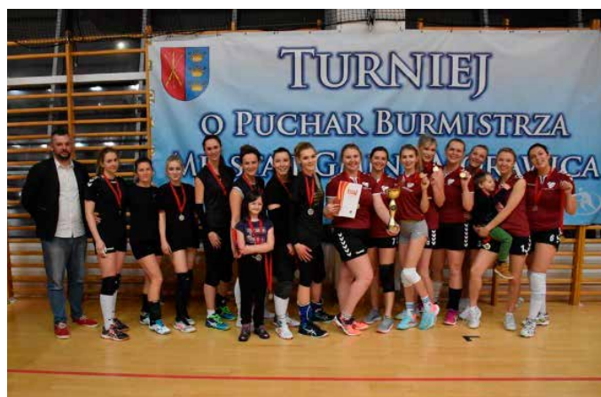
Finalistki VII edycji MLS Kobiet.

Kociaki uległy LZS Pińczów po zaciętym czterosestym meczu finału VII edycji Morawickiej Ligi Siatkówki Kobiet.