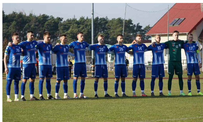
Moravia Anna-Bud Morawica

Od meczu w 1/8 pucharu Polski na szczeblu województwa Świętokrzyskiego rozpocznie rywalizację Moravia Anna-Bud Morawica. Rywalem na własnych obiektach będzie zespół GKS Rudki. Mecz zaplanowano na 6 marca 2022r. Nasi reprezentanci rywalizację rozpoczęli od IV rundy gdzie pokona-