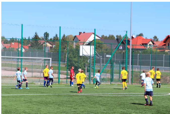
Rozgrywki młodzieżowe.

Bardzo prężnie rozwijająca się Akademia Piłkarska Kopalnia Talentów Moravia Morawica będzie miała dwa zespoły w najwyższych ligach juniorskich województwa. Do młodzików starszych (rocznik 2009-10) dołączyła po wygraniu