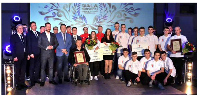
Laureaci III Gali Sportu 2020.

Po rocznej przerwie spowodowanej pandemią na miesiąc kwiecień 2022r. planowana jest IV Gala Sportu Miasta i Gminy Morawica. Wydarzenie, które odbędzie się w Hali