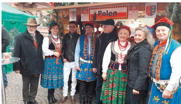
Podczas partnerskiej wizyty delegacja z Miasta i Gminy Morawica wzięła także udział w dorocznym jarmarku bożonarodzeniowym. Stoisko cieszyło się wielkim zainteresowaniem.