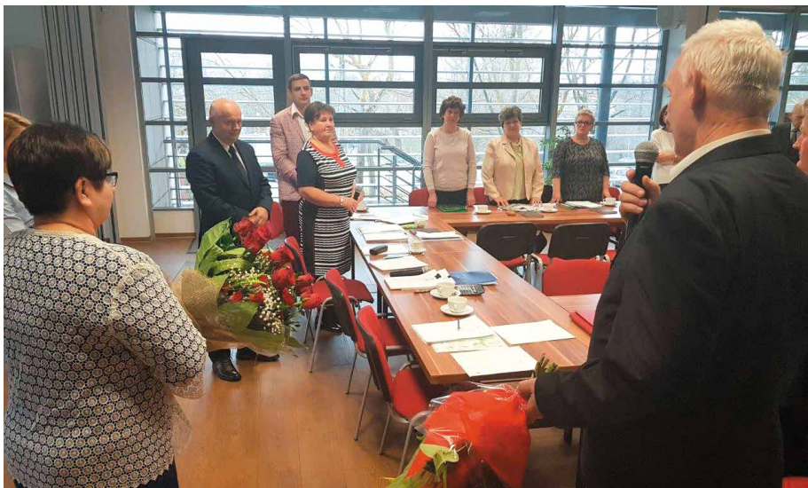
Sesja budżetowa to jedna z najważniejszych sesji w roku.

Jak podkreślano podczas posiedzenia sesji, do najważniejszych inwestycji zaplanowanych na 2018 rok należą: budowa dróg na terenie gminy, termomodernizacja budynku Zespołu Szkół w Brzezinach, rozbudowa Zespołu Szkół w Bilczy – budowa żłobka, rozpoczęcie