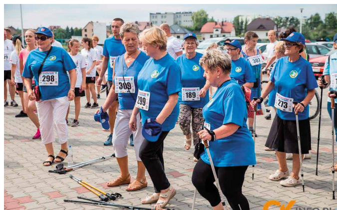
Klub Seniora "Zawsze młodzi" wzięły udział w akcji