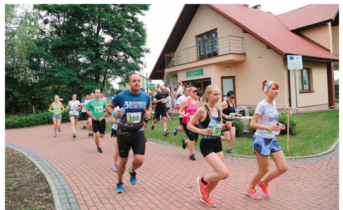
W Biegu o Laur Brzezín wzięło udział ponad stu zawodników