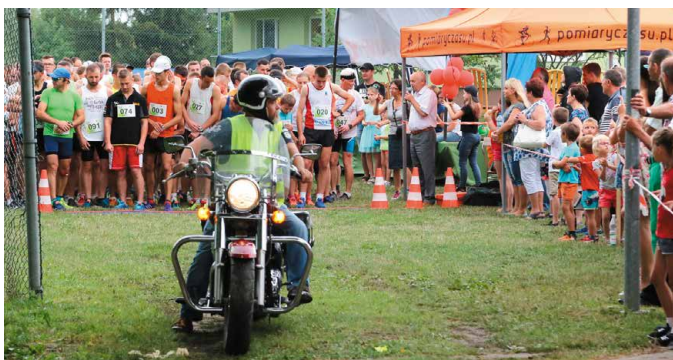
Biegaczy eskortowała policja