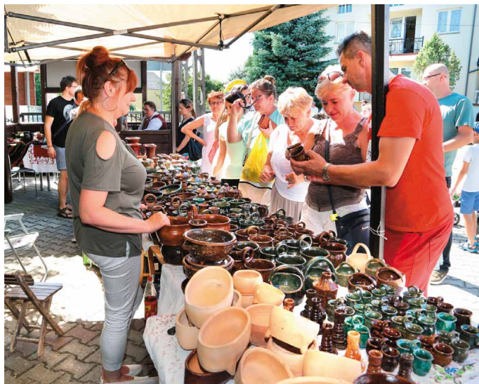
Gliniane cudeńka wracają do łask, ciesząc się rosnącą popularnością

Na "Chałupkowe Garcynki" zjechali garncarze z całego kraju, prezentując własnoręcznie robione gliniane cudeńka. Można