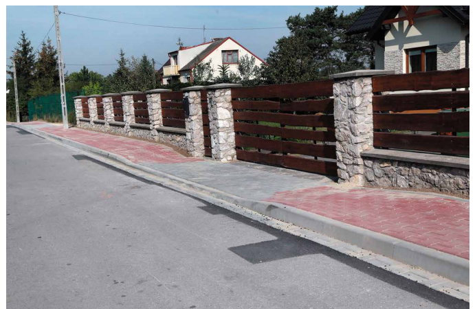
Komisja dokonała już odbioru nowego ciągu pieszego