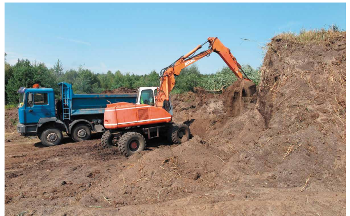
Prace przy budowie boisk idą pełną parą

Kolejną inwestycją, jaka zostanie tu zrealizowana w niedalekiej przyszłości będzie budowa świetlicy wiejskiej. - Będzie to świetlica dla mieszkańców Bieleckich Młynów i Piasecznej Górki. Warto podkreślić, że na budowę świetlicy pozyskano 300 tysięcy dofinansowania zewnętrznego z Programu Roz-