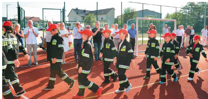
Jedyna w województwie Dziecięca Drużyna Pożarnicza z Woli Morawickiej zaprezentowała się na najwyższym poziomie