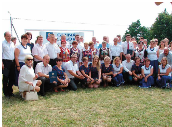
Stowarzyszenia przy współpracy z gminami otrzymały dofinansowanie w ramach konkursu „Odnowa wsi świętokrzyskiej”