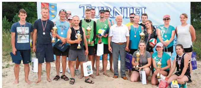
Nagrodzeni z dumą prezentują zdobyte puchary

Turniej mężczyzn rozgrywany był systemem „brazylijskim” – tzn. zespół odpadał po przegraniu dwóch spotkań w turnieju. W górnej części drabinki turniejowej dominował zespół