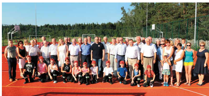
Goście zjazdu w komplecie tuż po pokazie Dziecięcej Drużyny Pożarniczej