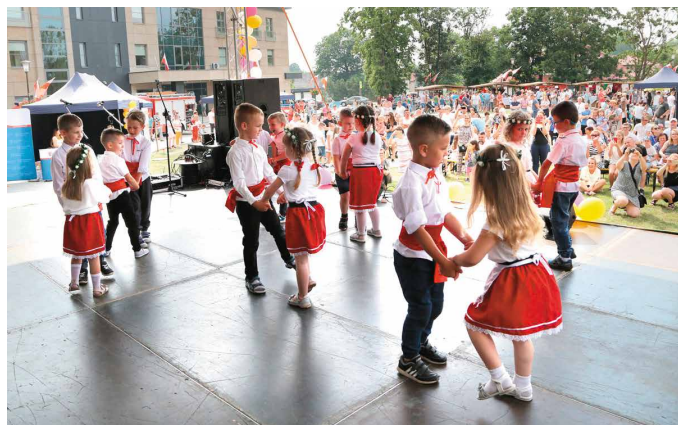
Występy dzieci zachwyciły zebranych