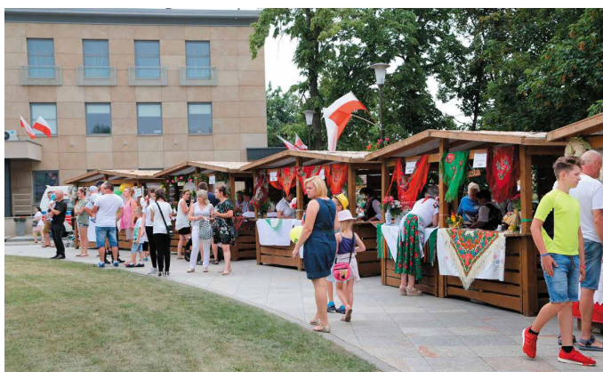
Wydarzeniu towarzyszył jarmark miejski z pysznościami i rękodziełem lokalnych artystów