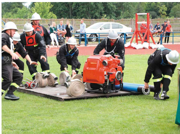
Morawiccy druhowie dali z siebie wszystko podczas zawodów i po raz kolejny udowodnili wysoki stopień przygotowania.