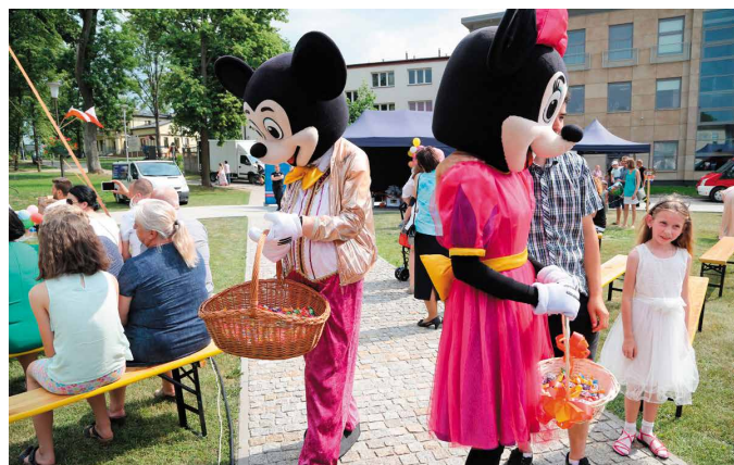
Gigantyczne maskotki rozdawały dzieciom słodycze

Nie nudził się ten, kto skorzystał z zaproszenia władz Miasta i Gminy Morawica na obchody Międzynarodowego Dnia Dziecka. Specjalnie dla najmłodszych mieszkańców przygotowano wiele atrakcji. Były wspaniałe zabawy i konkursy sportowe, plastyczne i artystyczne, malowane kreacje dla dzieci, zabawy animacyjne, rodzinny triathlon, maskotki roznoszące słodycze, konkursy z nagrodami, losowanie fantów, szczudlarz z pokazem olbrzymich baniek mydlanych i musztra strażacka w wykonaniu Młodzieżowej drużyny Pożarniczej z Woli Morawickiej. Nie zabrakło malowania twarzy, a w programie znalazły się także występy artystyczne grup tanecznych, wokalistek, a także dzieci przedszkolnych i szkolnych z terenu Miasta i Gminy Morawica. Zaproszono także dzieci na