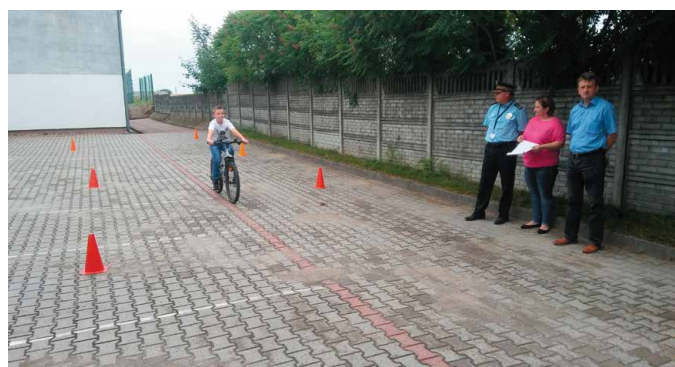
Egzamin na kartę rowerową wymagał dużej wiedzy

Poza tym, w związku ze zbliżającymi się wakacjami funkcjonariusze Straży Miejskiej w Morawicy, przeprowadzili pogadankę na temat bezpiecznego zachowania nad wodą, zagrożeń podczas prac polowych, czy zachowania w stosunku do osób obcych. Na zakończenie prelekcji życzone wszystkim uczniom bezpiecznych wakacji.