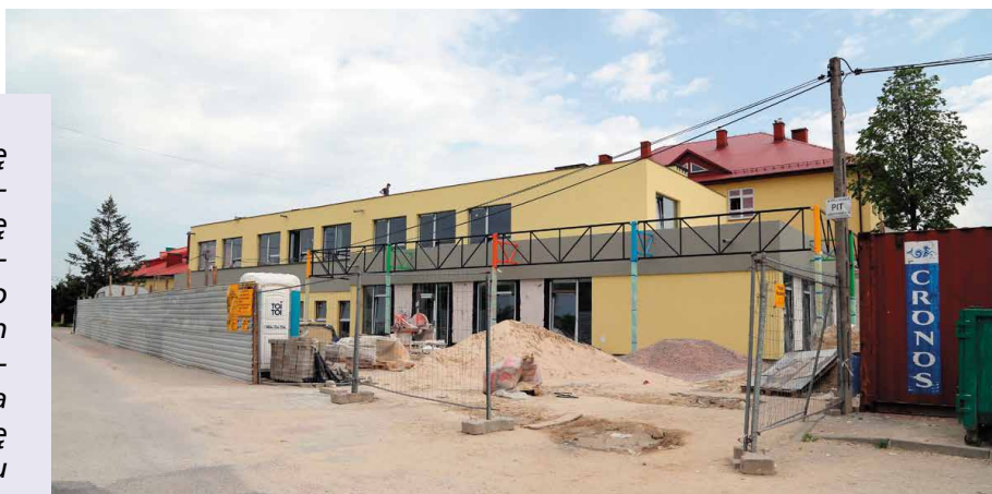
Intensywne prace nad budową żłobka nadal trwają

Koszt inwestycji opiewa na kwotę 3 milionów 160 tysięcy, z czego 1 milion 20 tysięcy złotych na budowę żłobka władze Miasta i Gminy Morawica pozyskały w ramach rządowego dofinansowania z programu "Maluch Plus". O kolejne środki, które mogłyby wspomóc wykonanie tego zadania morawiccy samorządowcy starają się w ramach Regionalnego Programu Operacyjnego Województwa Świętokrzyskiego.