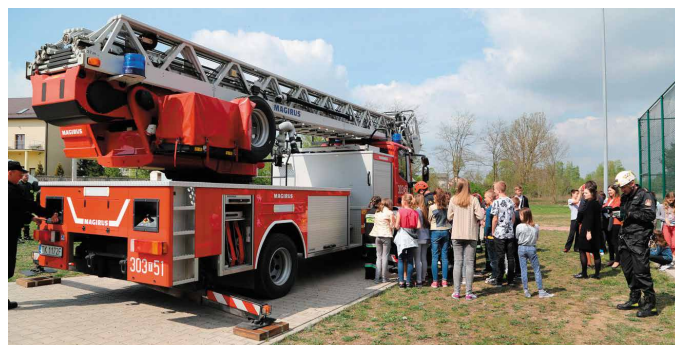
W przerwie między rozgrywkami odbyły się pokazy strażackie