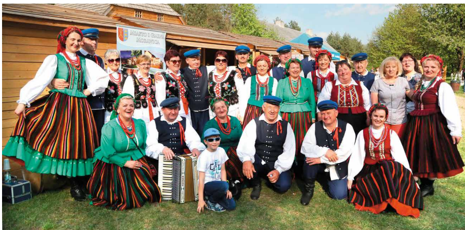
Zespół Pieśni i Tańca Morawica pięknie się zaprezentował

Tegoroczny III Festiwal Świętokrzyskie Smaki w Tokarni odwiedziło w ciągu dwóch dni dziewięć tysięcy osób.