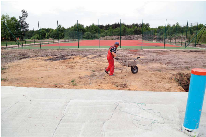
Prace nad realizacją inwestycji idą pełną parą

Warto podkreślić, że na budowę świetlicy pozyskano 300 tysięcy dofinansowania zewnętrznego z Programu Rozwoju