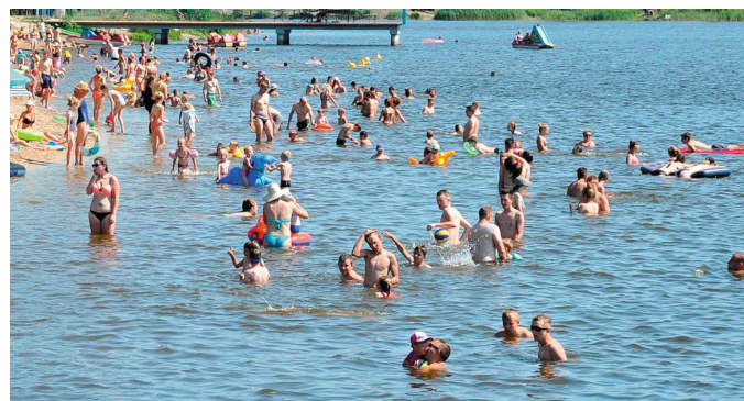
Doskonale warunki doceniają mieszkańcy i turyści, którzy nad morawicki zalew chętnie przyjeżdżają się kąpać już od długiego weekendu majowego.