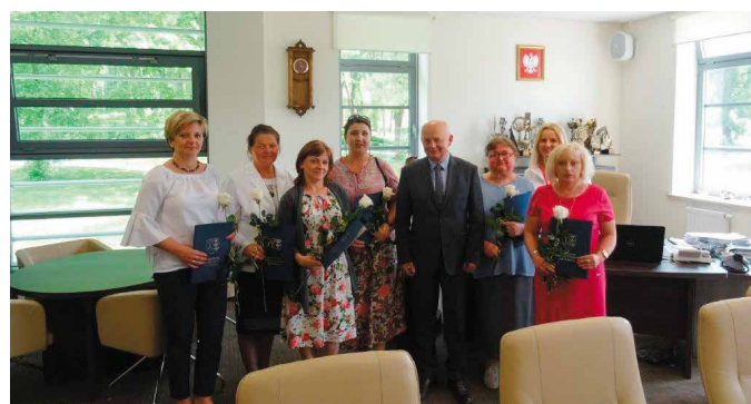
Specjalne podziękowania popłynęły do pracowników bibliotek

Jak podkreślano podczas spotkania, zawód bibliotekarza nie ogranicza się tylko do podawania książek czytelnikom. Praca ta wymaga nie lada znajomości w zakresie literatury z różnych dziedzin