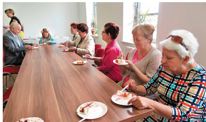
Na wszystkich przybyłych mieszkańców czekał tort