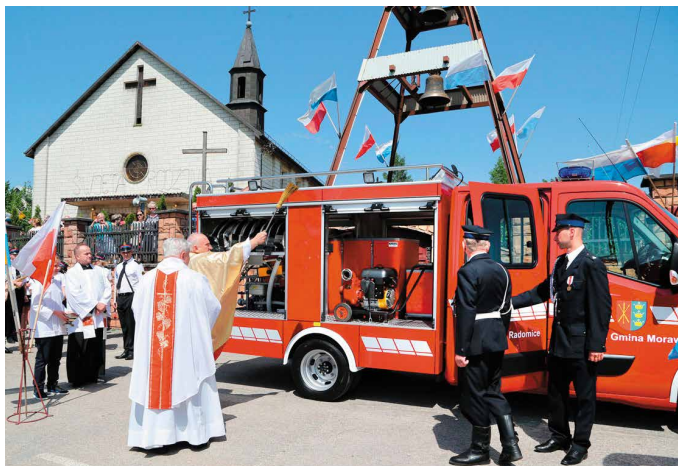
Po mszy dokonano uroczystego poświęcenia nowego samochodu