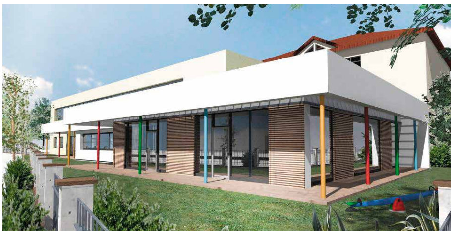
Tak będzie wyglądała część rozbudowana szkoły w Bilczy