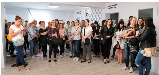
Tłumy Pań przybyły na otwarcie Studia Figura