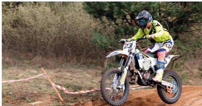
Miłośnicy ekstremalnej jazdy mogli podziwiać podczas wyścigów prawdziwych mistrzów