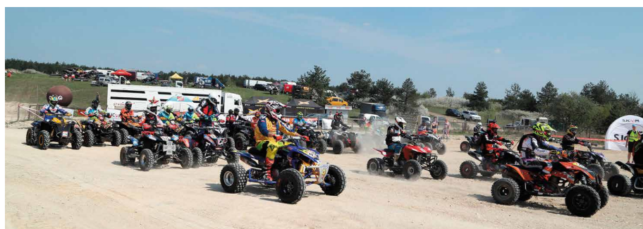
Takie maszyny można było podziwiać na starcie rajdu