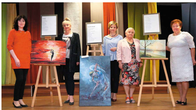
Zwyciężczynie konkursu z dumą prezentują swoje prace