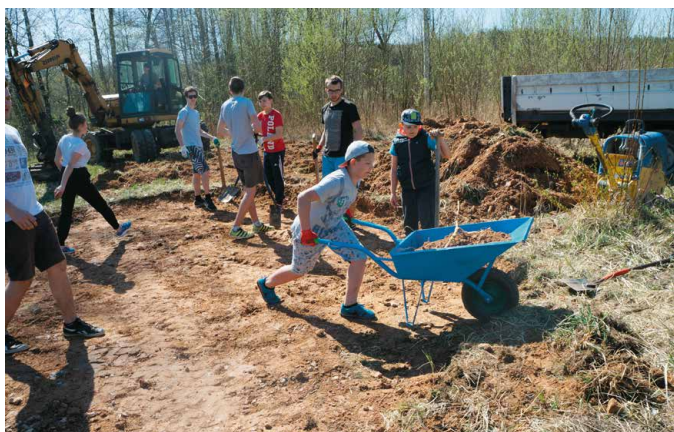
Z taczkami, w pocie czoła wszyscy ciężko pracowali