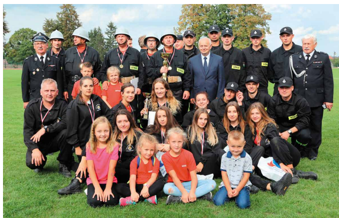
Powiat kielecki reprezentowały trzy drużyny. wszystkie pochodzą z terenu Miasta i Gminy Morawica

Konkurencja była bardzo duża. Drużyny szły dosłownie łeb w łeb, a o zwycięstwie decydowała nie tylko szybkość, ale przede wszystkim precyzja i opanowanie. Jak się okazało, nasi druhowie zaprezentowali się na najwyższym poziomie i ponownie nie mieli sobie równych. Druhowie z OSP z Brudzowa zwyciężyli w swojej kategorii, broniąc tym samym tytułu mistrza, jaki zdobyli w ostatnich zawodach wojewódzkich, które odbyły się cztery lata temu. Warto dodać, że druhowie z Brudzowa reprezentowali powiat kielecki podczas odbywających się co cztery lata wojewódzkich zawodów już w 2002 roku, w 2006 roku i w 2014 roku za każdym