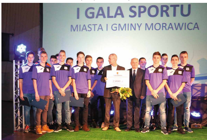
Junior Młodszy KS Moravia III miejsce