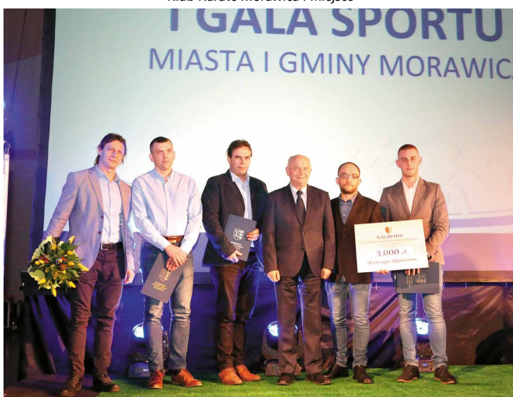
Grupa Alpinistów II miejsce