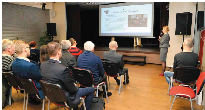
Spotkania z przedstawicielami stowarzyszeń są organizowane każdego roku