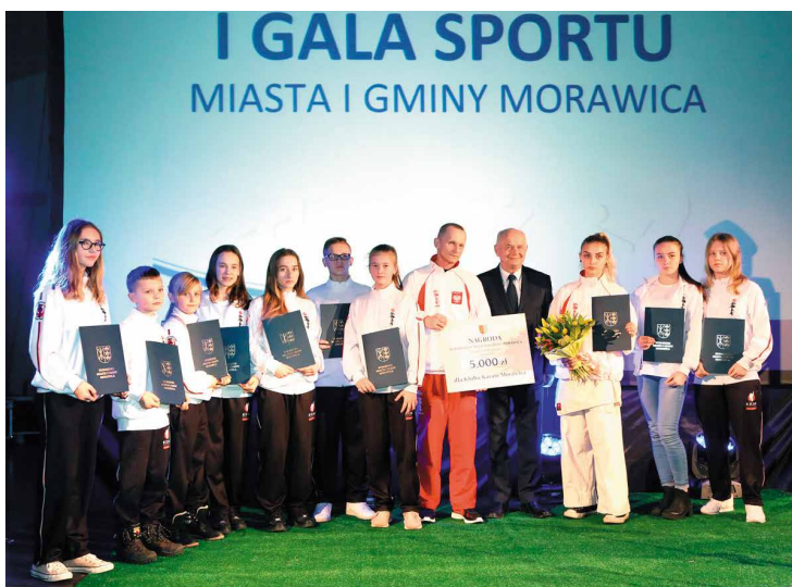
Klub Karate Morawica I miejsce