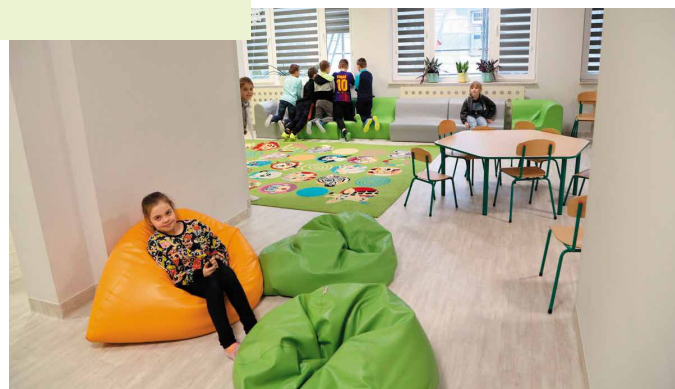
Nowe sale są jasne i przestronne