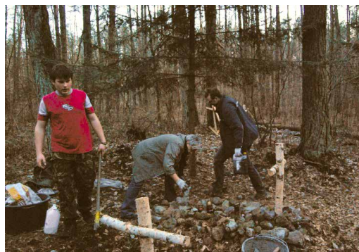
Zdmurszałe krzyże na zapomnianych grobach partyzanckich w bilczańskim lesie zostały wymienione. Tym samym groby ocalono od zapomnienia.