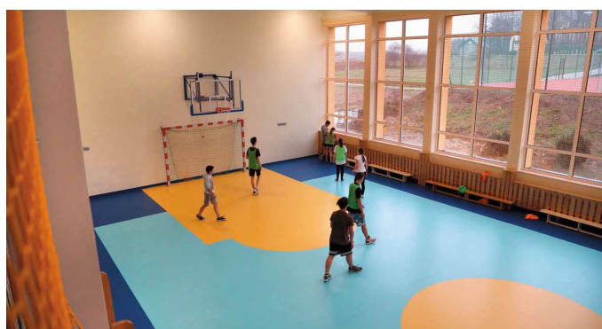
Wnętrze sali sportowej całkowicie zmieniło swoje oblicze