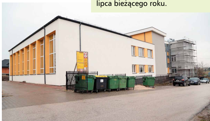
Sala sportowa przeszła już gruntowny remont