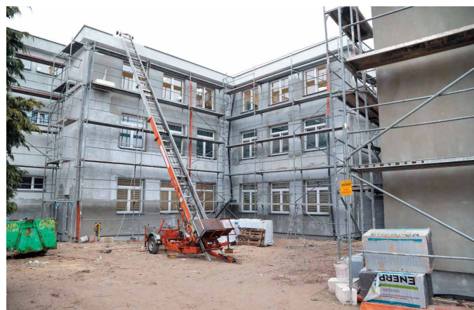
Budowa jest prowadzona tak, aby nie zakłócać zajęć lekcyjnych

Zakres robót budowlanych obejmie między innymi: wymianę stolarki okiennej i drzwi zewnętrznych, częściową wymianę instalacji centralnego ogrzewania i kotłów gazowych, docieplenie ścian zewnętrznych budynku oraz wymianę dachu na stropodach. W tym przypadku wykonanie ocieplenia istniejącego dachu jest niemożliwe ze względu na konieczność zachowania wymaganych wysokości pomieszczeń dla tego typu obiektów. Warto też dodać, że w ramach zadania zostanie wymienione także oświetlenie na ledowe. Zakończenie inwestycji przewidziano na koniec lipca bieżącego roku.