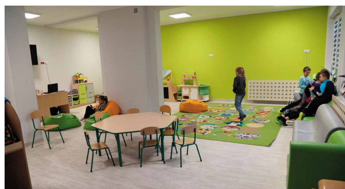
Nowoczesne pomieszczenia zachwycają wnętrzami i wyposażeniem