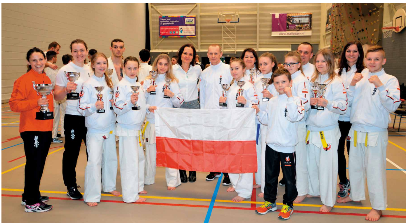
Młodzi mistrzowie z dumą prezentują zdobyte puchary