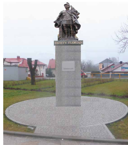
Tak wygląda wizualizacja pomnika Świętego Floriana, patrona strażaków