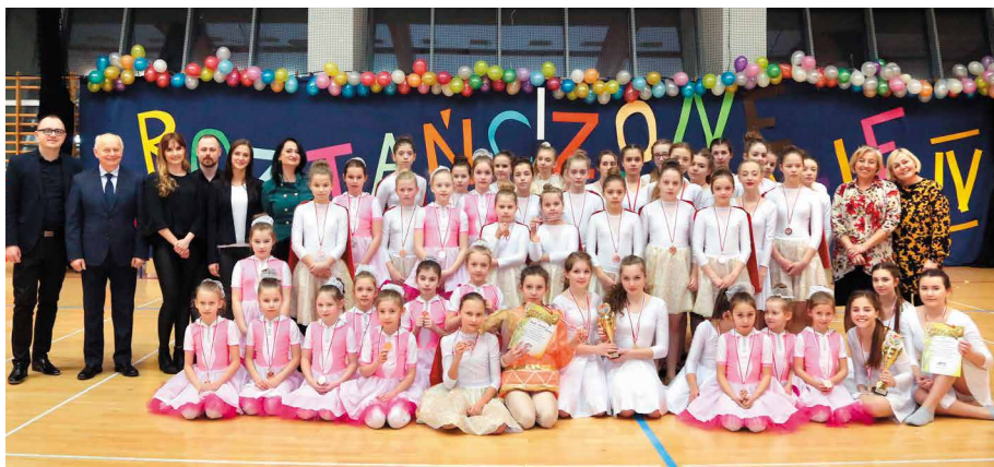
Morawicy tancerze zaprezentowali najwyższy kunszt artystyczny