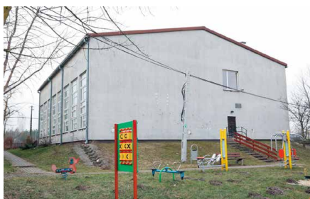
Hala gimnastyczna nie zostanie wyburzona. Przejdzie termomodernizację