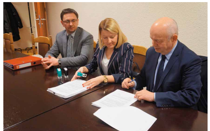
Uroczystość podpisania umów na dofinansowanie odbyła się w siedzibie Urzędu Wojewódzkiego w Kielcach.