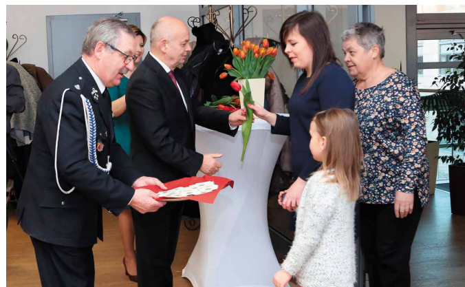
Panie już w drzwiach były witane kwiatami