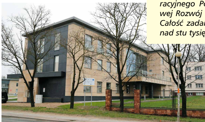
Kino powstanie na parterze kompleksowo wyremontowanego budynku