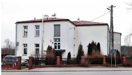
Budynek szkoły w Woli Morawickiej będzie wyburzony

Istniejący budynek Szkoły Podstawowej w Woli Morawickiej zostanie wyburzony pod budowę obwodnicy. Szkoła już została przejęta przez Generalną Dyрекcję Dróg Krajowych i Autostrad. W chwili obecnej, prowadzące szkołę stowarzyszenie wynajmuje budynek od jego zarządcy. - Szkoła w Woli Morawickiej to szkoła z ponad stuletnią tradycją. Mieszkańcy podkreślali konieczność budowy nowego budynku oświatowego w tej miejscowości. Przychylając się do