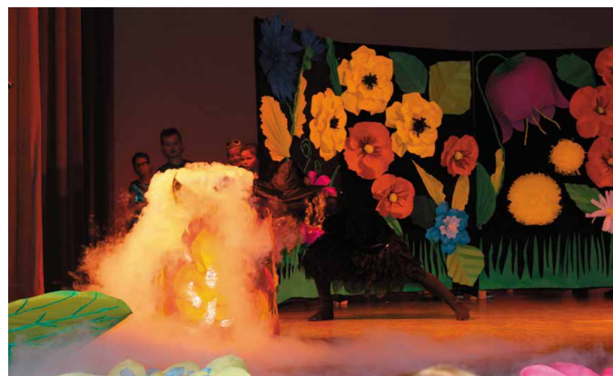
Para z kotła czarownicy to jeden z efektów specjalnych, który zaskoczył publiczność