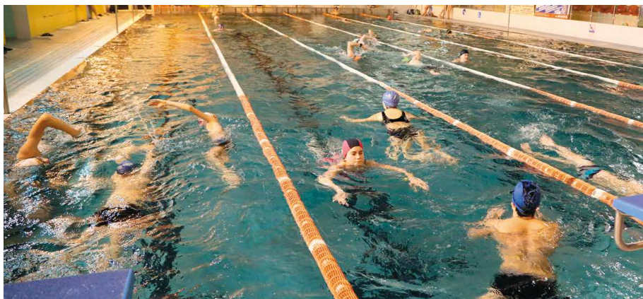
W tegorocznej edycji wystartowało 51 zawodników, którzy łącznie przepłynęli 375 kilometrów i 325 metrów. To nowy rekord pływalni!