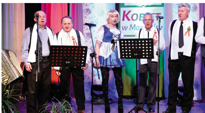
„Kabaret jeszcze nie starszych panów” z Morawicy zaprezentował sporą dawkę dobrego humoru