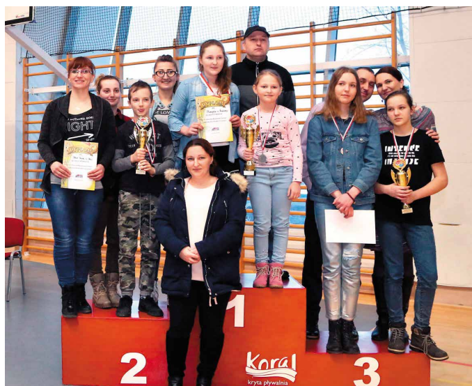
W tegorocznych zmaganiach trzeba było ułożyć puzzle składające się z pięciuset elementów. Najlepsza okazała się drużyna "Płomyki" w Radomic.