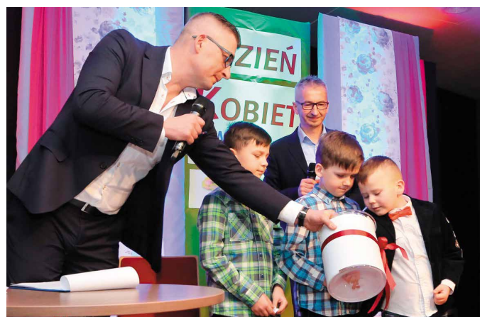
Niespodzianką była loteria fantowa z cennymi nagrodami