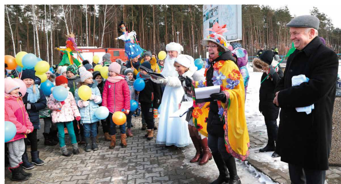
Nad morawickim zalewem skutecznie wygoniono zimę. Wiosna zawitała dostojnie za kilka dni!